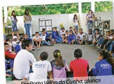
Em Porto Velho do Cunha, alunos conversam sobre a Mata Atlântica