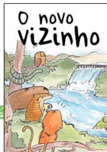
Cartilha distribuída para os alunos das escolas no entorno da UHE Itaocara