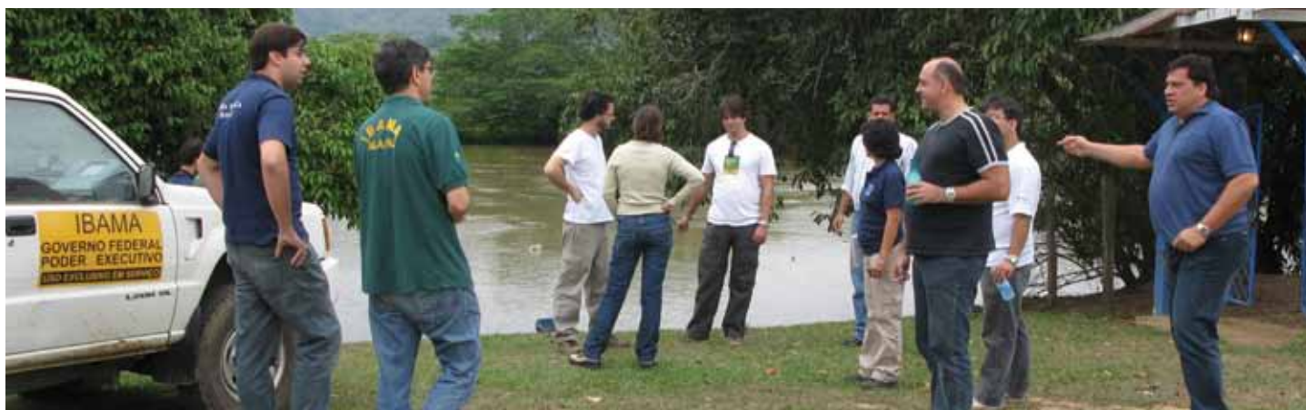
Equipe de licenciamento do Ibama percorre a região em visita técnica

Nos dias 21 e 22 de outubro, técnicos do Instituto Brasileiro do Meio Ambiente e dos Recursos Naturais Renováveis (Ibama), responsáveis pelo processo de licenciamento ambiental da Usina Hidrelétrica Itaocara,