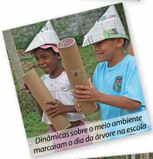
Dinâmicas sobre o meio ambiente marcaram o dia da árvore na escola