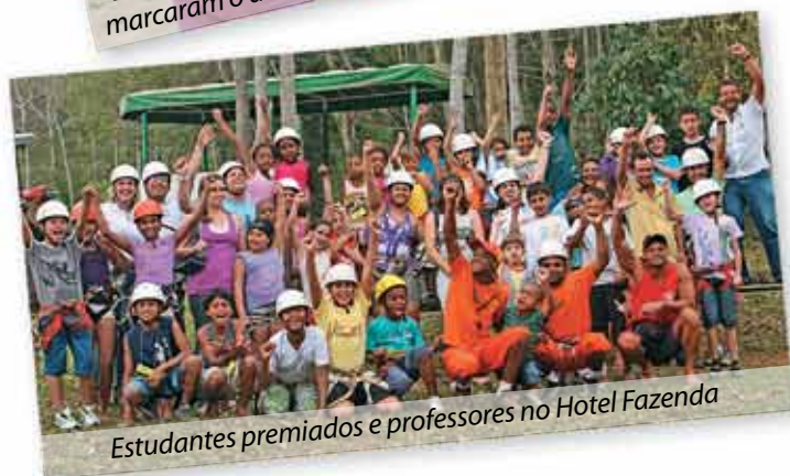
Estudantes premiados e professores no Hotel Fazenda