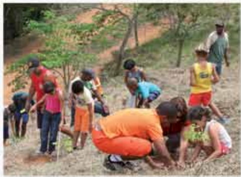
Alunos plantaram espécies nativas da região