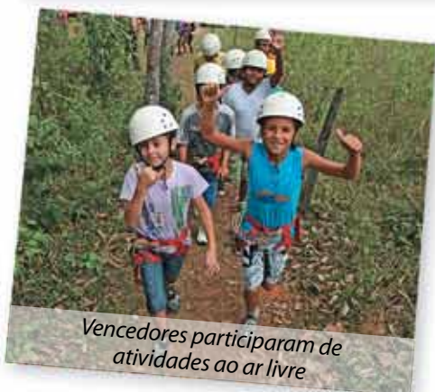
Vencedores participaram de atividades ao ar livre

O Dia das Crianças deste ano foi comemorado de uma forma especial por 35 estudantes da região. Eles foram os vencedores do I Concurso de Desenho da UHE Itaocara e ganharam um passeio de um dia ao Hotel Fazenda Gamela, em Cantagalo. O concurso, que teve como tema a Mata Atlântica, foi realizado em sete escolas da região durante a semana do Dia da Árvore. Ao todo, 165 alunos do 1º ao 5º ano participaram da atividade.