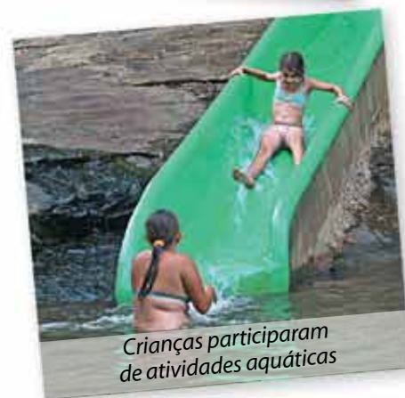
Crianças participaram de atividades aquáticas